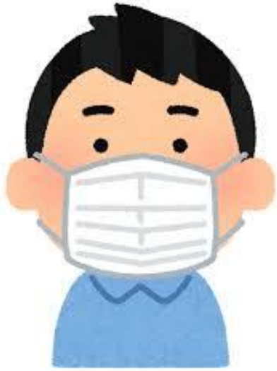
利用中のマスク着用 (運動中は任意)