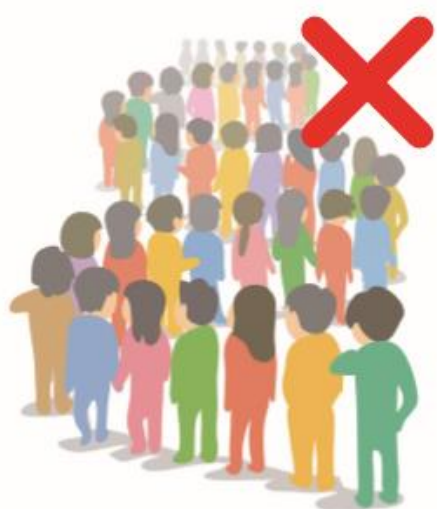
混雑状況によって入場 を制限させていただく 場合がございます