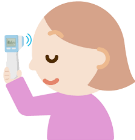
検温の実施 体調が優れない場合は ご利用をお控えくだ さい。