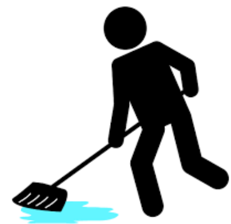
クリーンタイムの実施